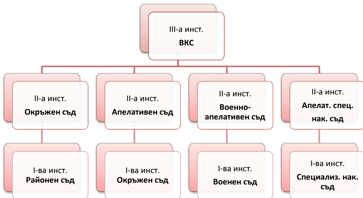
Съдебно производство по граждански и наказателни дела

Съдебното производство по граждански и наказателни дела е триинстанционно, освен ако със закон не е предвидено друго, а по административни дела – двуинстанционно.